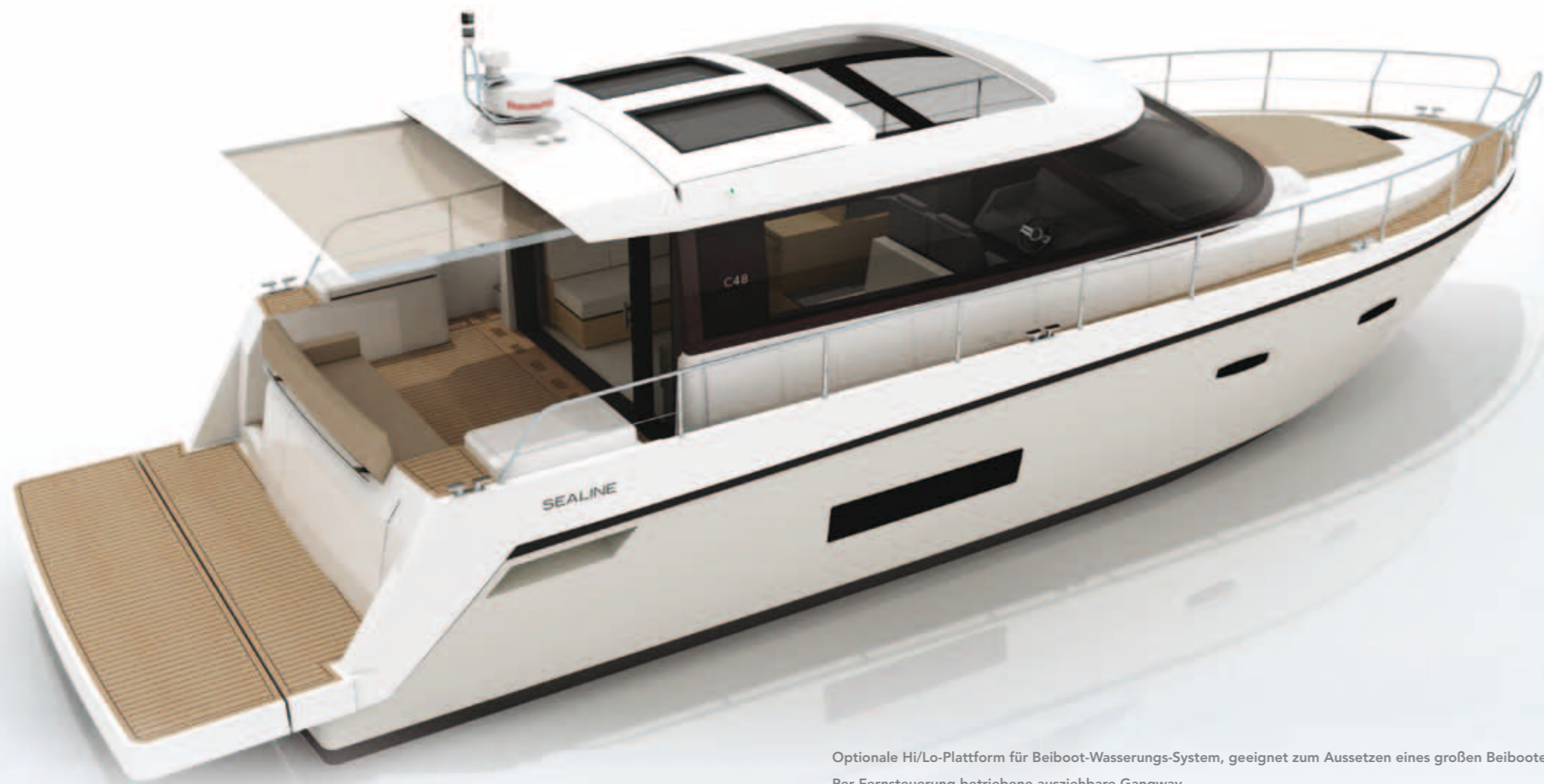
Optionale Hi/Lo-Plattform für Beiboot-Wasserungs-System, geeignet zum Aussetzen eines großen Beibootes Per Fernsteuerung betriebene ausziehbare Gangway